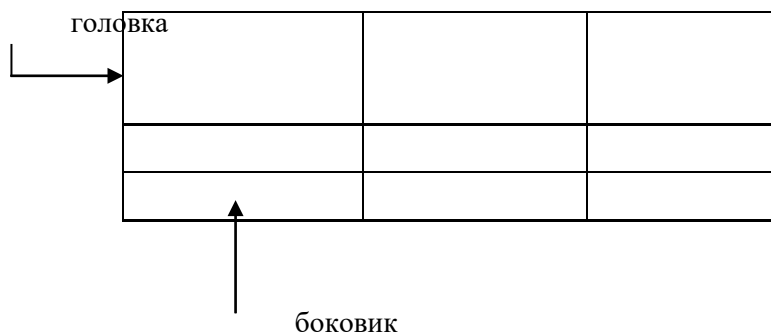
Таблица _____ – _____ номер название таблицы

Допускается помещать таблицу вдоль длинной стороны листа документа.