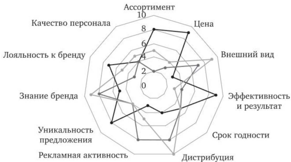
Рис. 6.1. Многоугольник конкурентоспособности:

—●— ваш товар; —●— конкурент 1; —●— конкурент 2