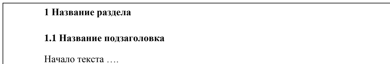
Рисунок 1 - Оформление заголовка и подзаголовка

Если подзаголовок располагается внутри текста, то между текстом и подзаголовком ставится интервал 18 пт, а между подзаголовком и текстом –12 пт. Пример оформления заголовка и подзаголовка представлен на рисунке 1.