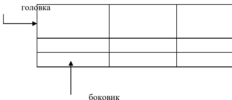
Таблица _____ – _____ номер название таблицы

Допускается помещать таблицу вдоль длинной стороны листа документа.