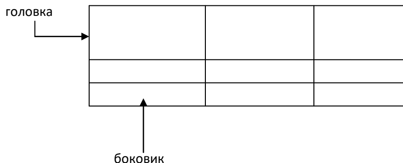
Таблица _____ – _____ номер название таблицы

Допускается помещать таблицу вдоль длинной стороны листа документа.