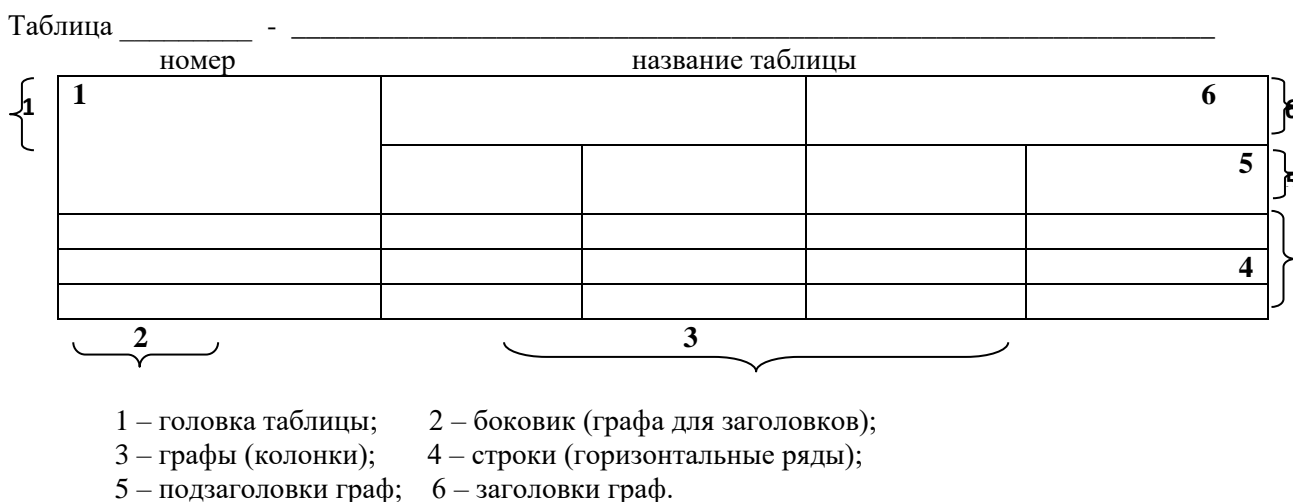
Рисунок 2 - Структурные элементы таблицы

Если строки и графы таблицы выходят за формат страницы, то в первом случае в каждой части таблицы повторяется головка, во втором случае – боковик. Структурные элементы таблицы отражены на рисунке 2.