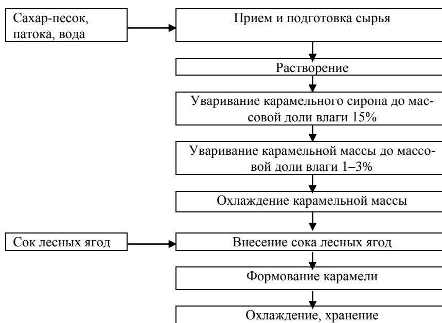
Рисунок 3.2 – Технологическая схема производства леденцовой карамели с соком лесных ягод