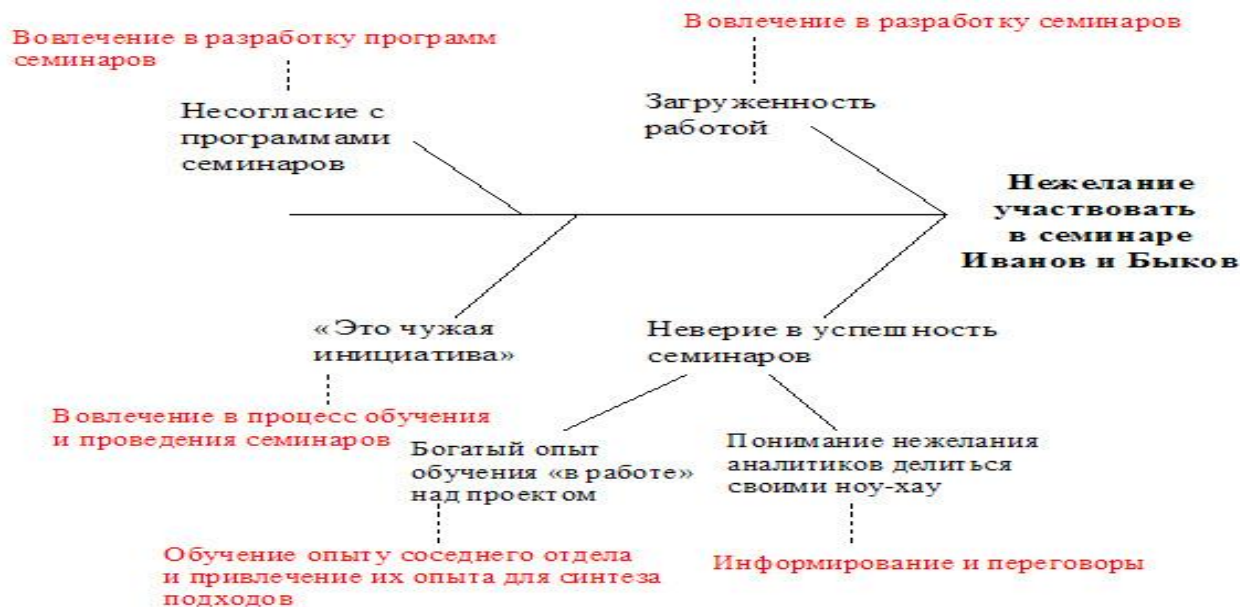
Рисунок - Причинно-следственная диаграмма для анализа источников сопротивления проводимым изменениям

и их принуждением), применялись ли подобные методы в связи с Вашим собственным сопротивлением предлагаемым изменениям?