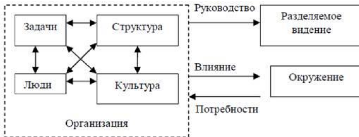
Модель Надлера – Ташмена

Используя модель Надлера - Ташмена и таблицу (приведенные ниже), на примере вашей организации, опишите определенную проблему, требующую проведения организационных изменений, оценив текущее и целевое состояние по всем ключевым областям, выделенным в модели. Оцените области разделяемого видения и серьезные проблемы - могущие вызвать несогласие и сопротивление персонала. Кто является лидером изменений и как он должен действовать, чтобы увеличить область разделяемого видения и облегчить проведение изменения?