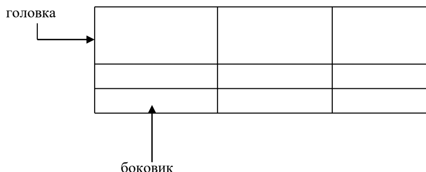
Таблица _____ – _____ номер название таблицы

Допускается помещать таблицу вдоль длинной стороны листа документа.