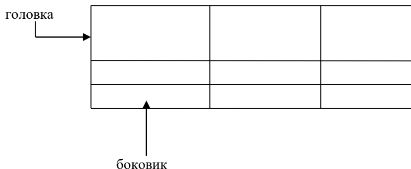
Таблица _____ – _____ номер название таблицы

Допускается помещать таблицу вдоль длинной стороны листа документа.