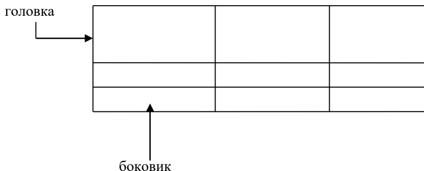
Таблица _____ – _____ номер название таблицы

Таблицы с большим количеством строк допускается переносить на другой лист (страницу). При переносе части таблицы на другой лист слово «Таблица» и номер её указывают один раз слева над первой частью таблицы, над другими частями также слева пишут слово «Продолжение» и указывают номер таблицы, например: «Продолжение таблицы 1». В каждой части повторяют головку таблицы.