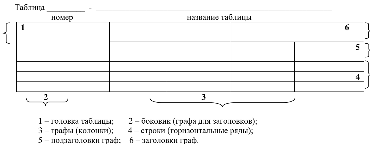
Рисунок 2 - Структурные элементы таблицы

Разделять заголовки и подзаголовки боковика и граф диагональными линиями не допускается. Графу «Номер по порядку» в таблицу также включать не допускается.