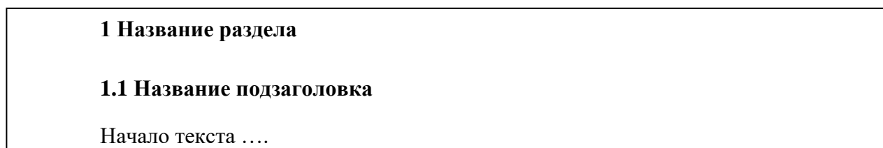
Рисунок 1 - Оформление заголовка и подзаголовка

Если подзаголовок располагается внутри текста, то между текстом и подзаголовком ставится интервал 18 пт, а между подзаголовком и текстом –12 пт. Пример оформления заголовка и подзаголовка представлен на рисунке 1.