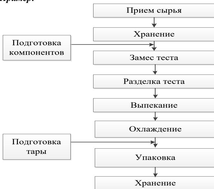
Рисунок 3.2 – Технологическая схема производства сдобных изделий

Иллюстрации каждого приложения обозначаются отдельной нумерацией арабскими цифрами с добавлением перед цифрой обозначения приложения. Например, рисунок В.4.