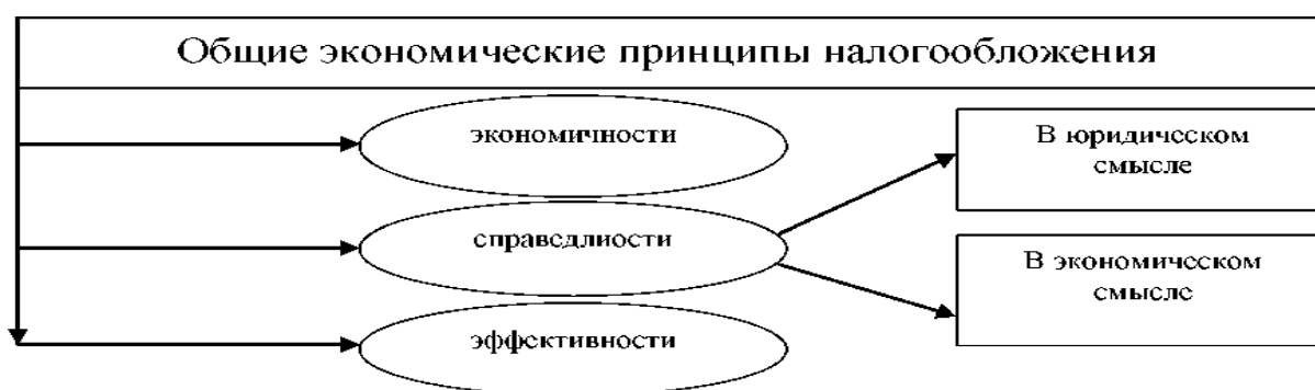
Рисунок 1 – Общие экономические принципы налогообложения

Нумерация рисунков сквозная по всей работе. В тексте работы, даётся ссылка на последующий рисунок. Например, «Взаимосвязь всех обозначенных принципов налогообложения можно представить в общем виде, как показано на рисунке 1.»