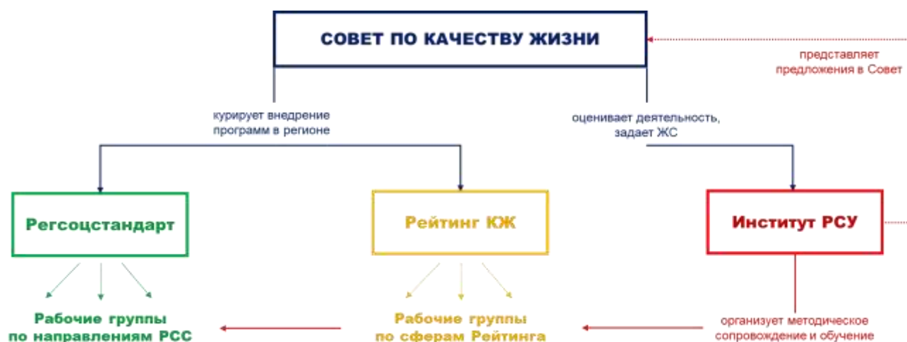
Рисунок 2.1 – Схема организации внедрения НСИ в Камчатском крае

Вообще, структурно организацию внедрения в Камчатском крае Национальной социальной инициативы можно изобразить в виде схемы на рисунке 2.1