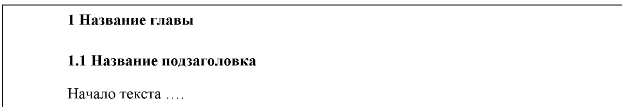
Рисунок 1 - Оформление заголовка и подзаголовка

12 пт. Если подзаголовок располагается внутри текста, то между текстом и подзаголовком ставится интервал 18 пт, а между подзаголовком и текстом –12 пт. Пример оформления заголовка и подзаголовка представлен на рисунке 1.